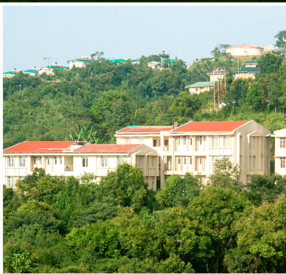
New SEMIS Block