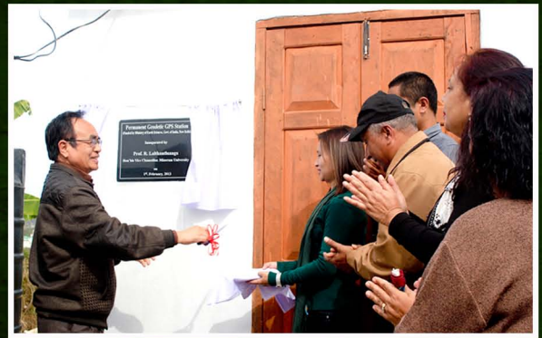
Gedoetic GPS Inauguration