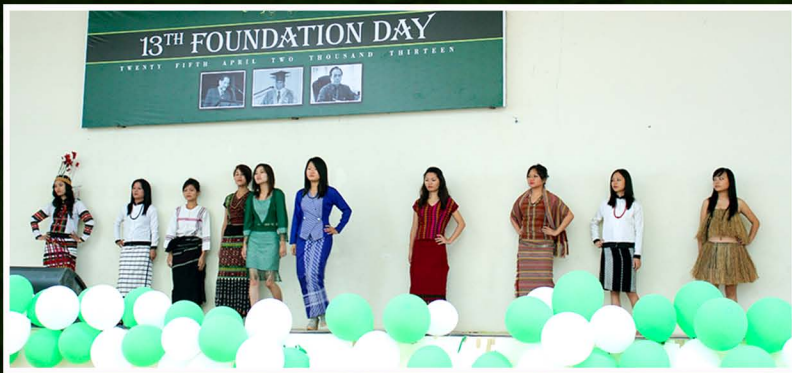
13th Foundation Day