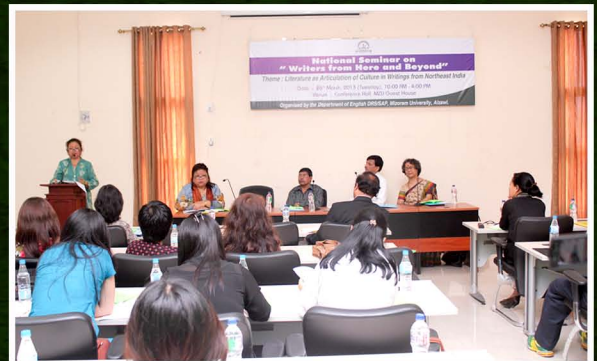
National Seminar on Writers