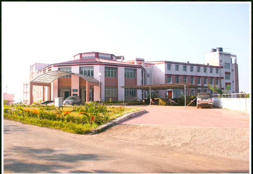
School of Physical Sciences