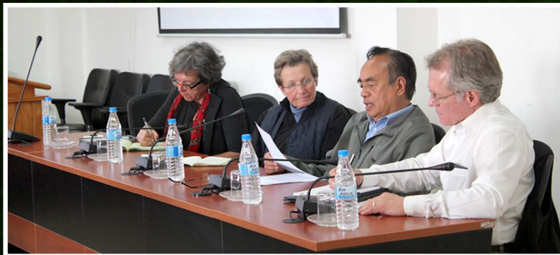
Discussion with Minnesota University