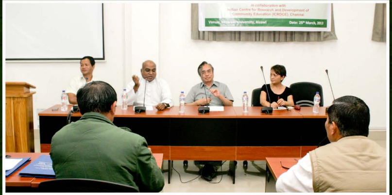
Workshop on Community College